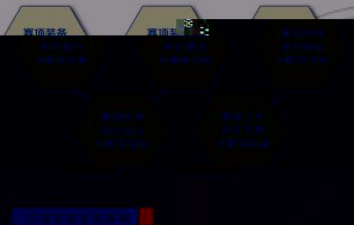
图 3-1 大赛资源“五转化”路径

将现代生产工艺流程、技术标准、 职业技能规范 引入教学过程，将学校教学过程和企业生产过程相结合，成功探索了一条大赛资源五转化路径。引领专业教学改革和专业建设，在专业建设、人才培养模式、课程体系、师资队伍、校企合作、工学结合等方面为职业院校提供引导。